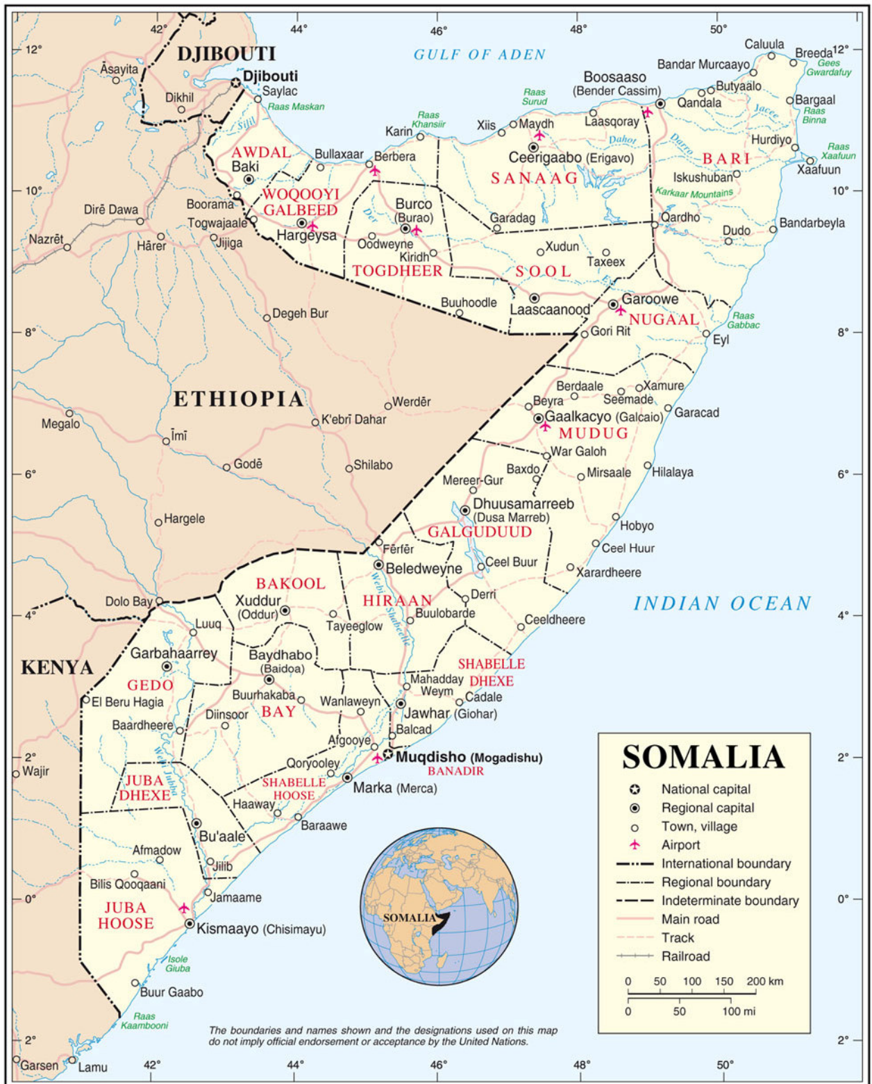
Szomália térképe 168