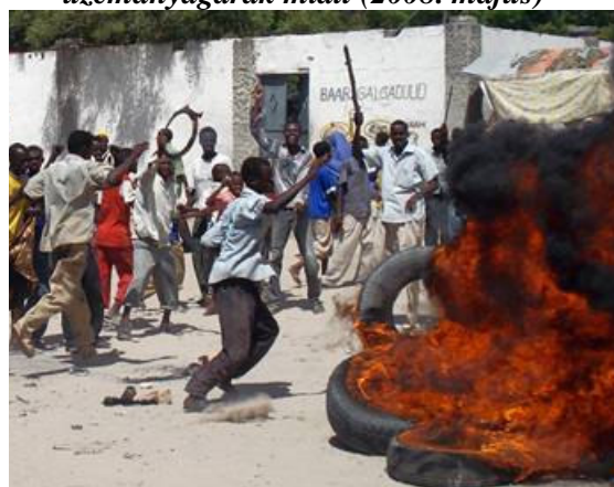
Szomálik tüntetnek a magas élelmiszer- és üzemanyagárak miatt (2008. május) 95

A somáli shilling drámai mértékben veszített értékéből, ami a nagyobb vidéki központokban már amúgy is nyomorban élők körében komoly nyugtalanságot illetve elégedetlenséget keltett. 2008 májusában több tízezren vonultak az utcákra tüntetni a magas élelmiszerárak miatt. Mogadishuban ketten életüket is veszítették és többen megsebesültek, miután katonák tüzet nyitottak a protestálókra. 96 Egy USA dollárért jelenleg körülbelül 1450 somáli shillinget adnak. 97 Az autonóm Puntföld régióban nyomtatott több millió hamis somáli bankjegy hiperinflációt eredményezett. Ma már a kereskedők többsége nem akarja elfogadni a shillinget, így a legtöbb tranzakciót dollárral bonyolítják. Ilyen körülmények között a legtöbb esélyük a túlélésre azon vidéki somáliknak van, akiknek módjában áll dollárhoz jutni, esetleg külföldi rokonok át tudnak nekik utalni valamennyi összeget. Az ország távoli sarkaiban élő pásztorkodó somálik, akiknek állatállománya megtizedelődött a szárazság következtében, a városokban összecsoportosulva próbálnak élelemhez vagy egyéb segítséghez jutni. 98