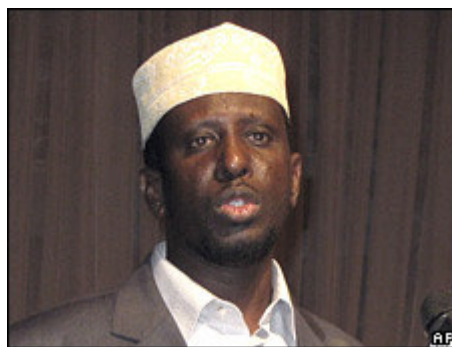
Sharif sejk békét és egységet ígért 70

akkori miniszterelnök Nur Haszan Huszein is indult a pozícióért. Esküjében Ahmed ígéretet tett arra, hogy békét és egységet hoz Szomáliának, és bárkivel hajlandó együtt dolgozni, aki osztozik ebben a küldetésben. Megjegyzendő, hogy napokkal korábban az etióp csapatok teljesen kivonultak Szomáliából.