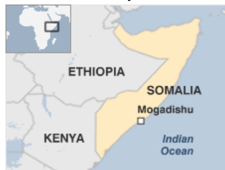
Szomália elhelyezkedése 69

A mérsékelt iszlamista Sharif Ahmed sejk 2009 januárjában választották meg Szomália törékeny átmeneti kormányának élére. Elődje Abdullah Juszuf Ahmed egy hónappal korábban mondott le posztjáról. Sharifot az erőszakot elkerülendő a szomszédos Dzsibutiban összeülő parlament választotta meg. Többek között az