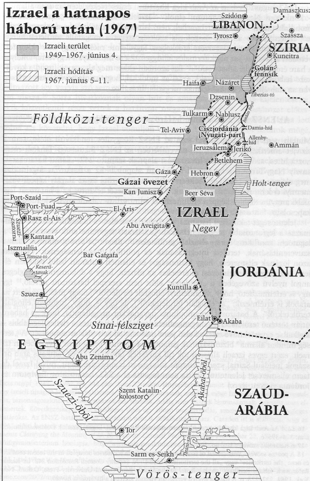
Izrael a hatnapos háború után (1967) 184